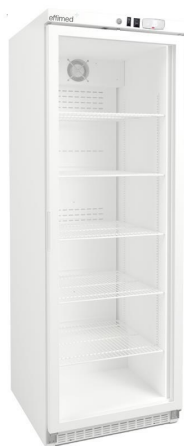
Frío para Farmacias - Refrigeradores para Farmacia +2 / +8°C - Línea EVO - Estantes metálicos