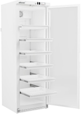
Línea EVO Cajones