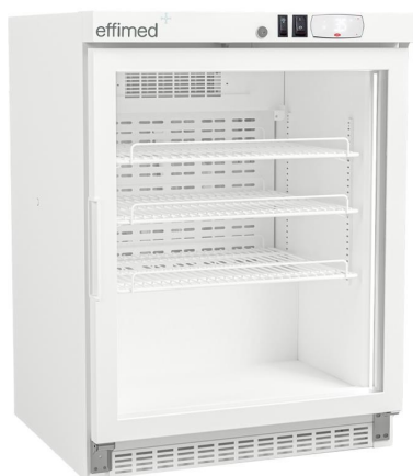
Frío para Farmacias - Refrigeradores para Farmacia +2 / +8°C - Línea EVO - Estantes metálicos