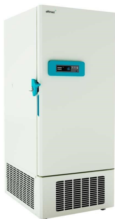
Frío para Laboratorios - Ultracongelación -40°C - Ultra congelación -40°C