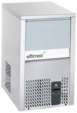
Máquina de hielo granular