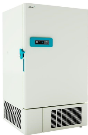
Frío para Laboratorios - Ultracongelación -40°C - Ultra congelación -40°C