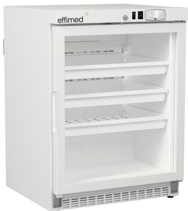
Frío para Farmacias - Refrigeradores para Farmacia +2 / +8°C - Línea EVO - Cajones