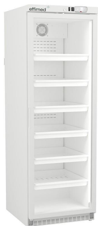
Frío para Farmacias - Refrigeradores para Farmacia +2 / +8°C - Línea EVO - Cajones