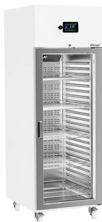
Frío para Laboratorios - Refrigeración +2 / +8°C - Línea EVO