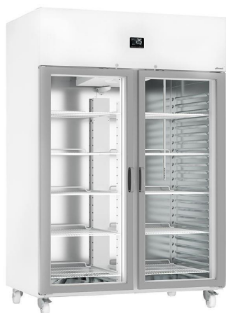
Frío para Laboratorios - Refrigeración +2 / +8°C - Línea Perfect - Puerta cristal