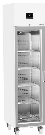
Frío para Laboratorios - Refrigeración +2 / +8°C - Línea Perfect - Puerta cristal