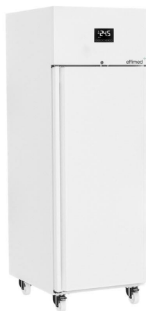
Frío para Laboratorios - Congelación -25°C - Línea Perfect