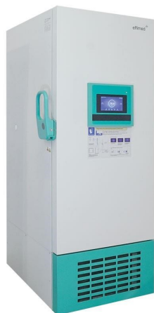
Frío para Laboratorios - Ultracongelación -86°C