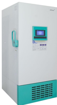
Frío para Laboratorios - Ultracongelación -86°C