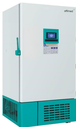
Frío para Laboratorios - Ultracongelación -86°C