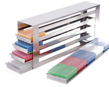
Racks deslizantes Inox