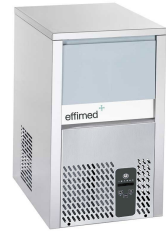
Máquina de hielo granular