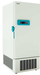
Ultra congelación -40°C