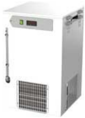
Recirculadores de agua